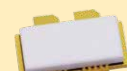
基地局用GaN GaN for base stations